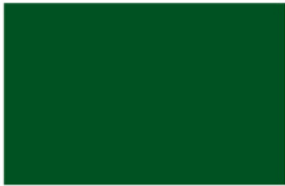
Larch Green K2434