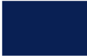
Ford Tractor Blue K8950