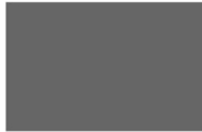
Dark Grey K9190