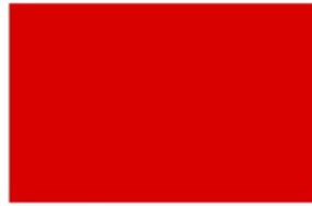
Post Office Red K8850