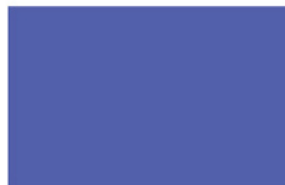
K9190 : K5000 1 : 1