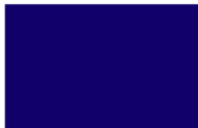
Pure Blue K3070