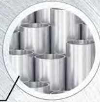
กัลวาไนซ์*