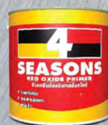
สีรองพื้นแดง