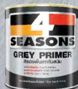
สีรองพื้นเทา