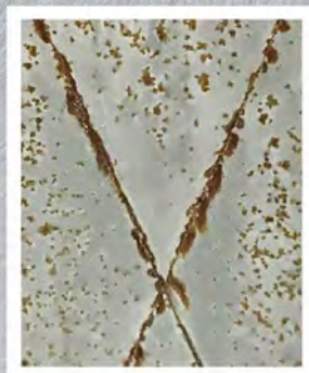
สีรองพื้นเทากันสนิม ยี่ห้ออื่น