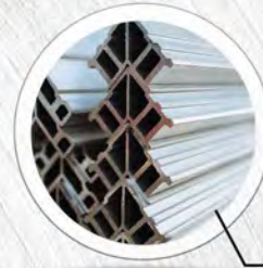
อลูมิเนียม*